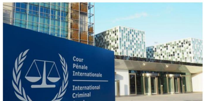
Sede de la Corte Penal Internacional, en La Haya.